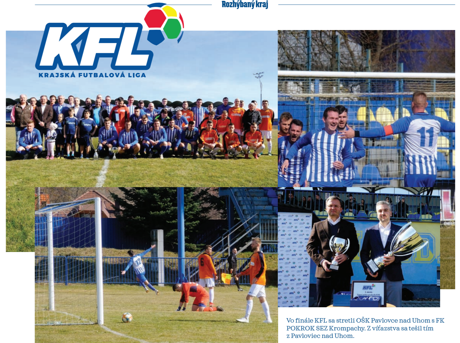
Vo finále KFL sa stretli OŠK Pavlovce nad Uhom s FK POKROK SEZ Krompachy. Z víťazstva sa tešil tím z Pavloviec nad Uhom.