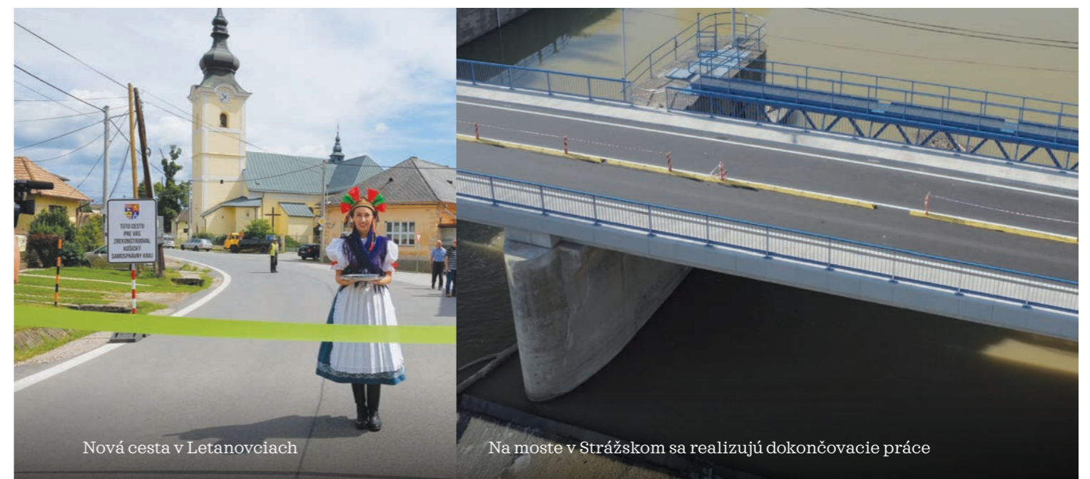
Nová cesta v Letanovciach

V tomto roku sa chce župa pustiť do opráv 30-tich mostov v kraji. V lete pokračovala oprava mosta v Strážskom nad riekou Laborec, župa začala s rekonštrukciou mostov v Boliarove a v Bačkovíku, opravy sa dočkal aj most medzi Gombošom a Perínom, most v Kováčovej nad potokom Čremošná aj most v extraviláne obce Hnilčík. V polovici augusta župa z bezpečnostných dôvodov uzavrela most nad Hornádom medzi obcami Kysak a Veľká Lodina. Iniciatívnou kontrolou krajskej samosprávy bol zistený jeho havarijný stav, na moste vznikla trhlina a prepad a hrozilo jeho zrútenie. Pre okres Košice-okolie bol vyhlásený mimoriadny stav a vytýčené boli obchádzkové trasy. Kraj sa bude rekonštrukciou tohto mosta zaoberať prioritne.