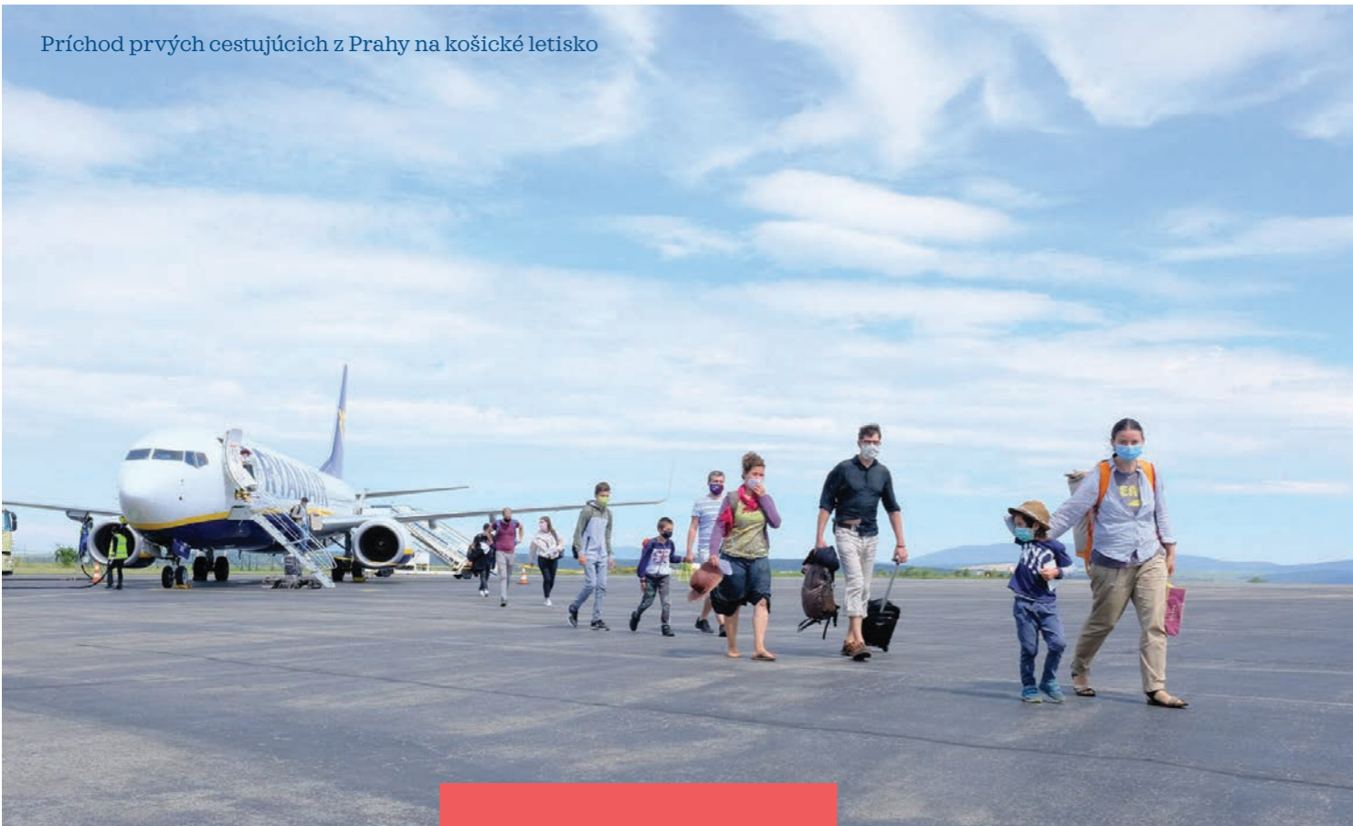
Príchod prvých cestujúcich z Prahy na košické letisko

Obyvateľom východného Slovenska pomôže rýchlo sa prepraviť k našim susedom z Čiech nové letecké spojenie. Spoločnosť Ryanair začala lietat' aj na nízkonákladovej linke medzi Košicami a Prahou. Popri spojení Košice - Londýn Stansted ide o druhú linku, ktorú z Košíc aktuálne prevádzkuje.