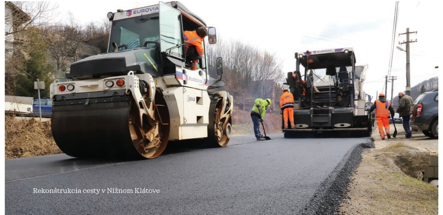
Rekonštrukcia cesty v Nižnom Klátove