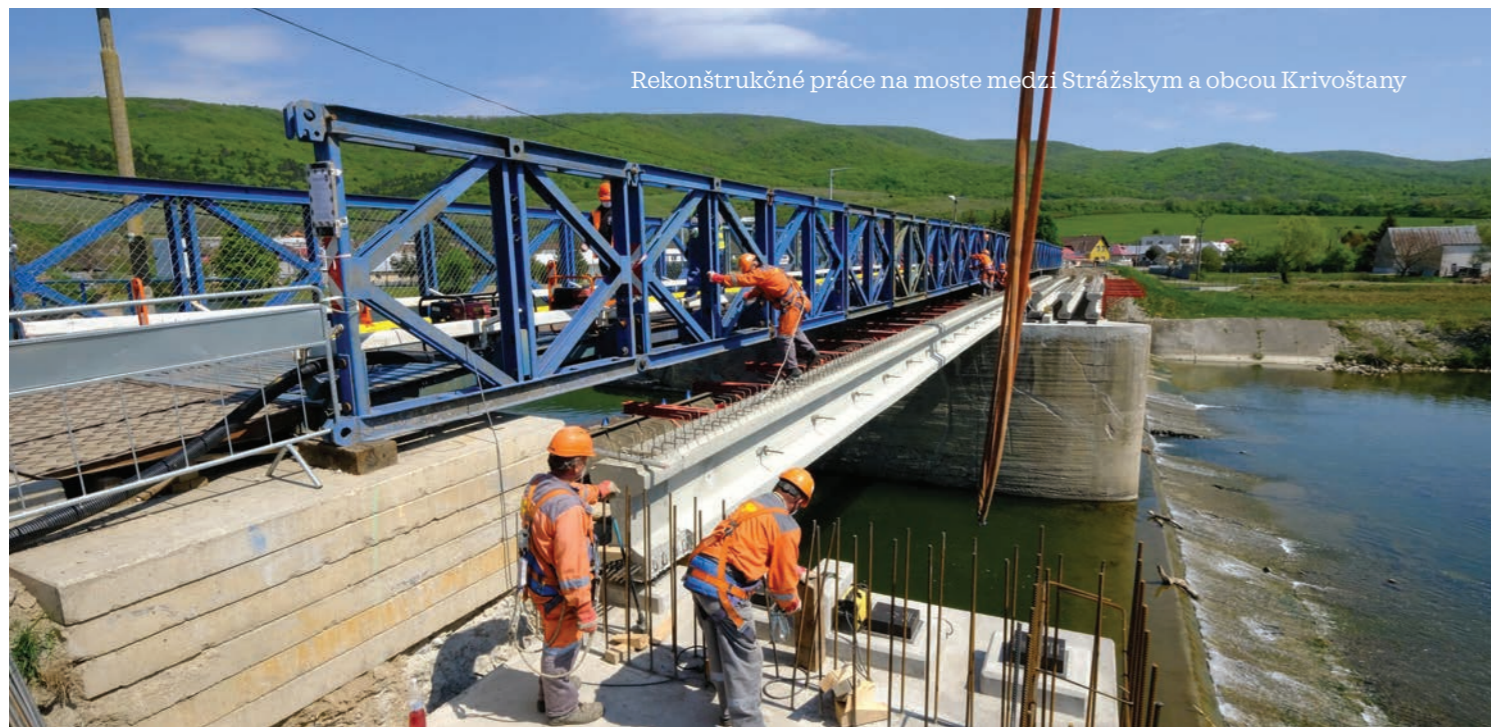
Rekonštrukčné práce na moste medzi Strážskym a obcou Krivoštiny

Župa je v aktuálnom volebnom období na 2. mieste spomedzi všetkých VÚC, čo sa týka účinnosti údržby a opráv mostov.