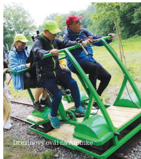
Drezinový ovál na Alpinke

Košický samosprávny kraj sa od roku 2019 zameriava vo vyššej miere na podporu veľkých infraštruktúrnych projektov, ktoré ostávajú na turistickej mape dlhodobo a majú potenciál prilákať návštevníkov aj zo vzdialenejších kútov Slovenska či sveta. Vďaka podpore kraja vznikol napríklad drezinový ovál na Alpinke, prvý na Slovensku. Je kombináciou cyklo a koľajovej jazdy, vďaka čomu ponúka unikátny zážitok. Počas tohto leta župa otvorila prvý zipline v kraji, vyrástol nad Beňatinským jazerom s tyrkysovou vodou, ďalší bude