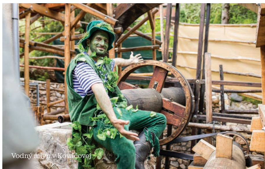
Vodný mlyn v Kováčovej

3 939 080 EUR z programu Terra Incognita 113 podporených podujatí 87 zrealizovaných infraštruktúrnych projektov