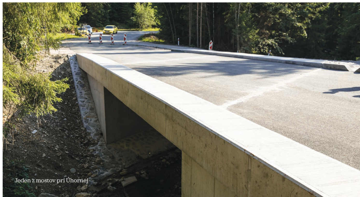
Jeden z mostov pri Úhornej

Pôvodným zámerom bolo zachovať a zosilniť pôvodnú nosnú konštrukciu, no už po pár dňoch od odovzdania staveniska zhotoviteľovi sa otvorila trhlina na nosnej klenbe a pádu časti rímsy. Po mimoriadnej prehliadke došlo k zhode, že most je potrebné zbúrať a vybudovať nový. Rekonštrukcia začala v októbri 2021 a stála 200-tisíc eur. Práce na mostných objektoch sú ukončené, v auguste ešte prebehnú dokončovacie práce.