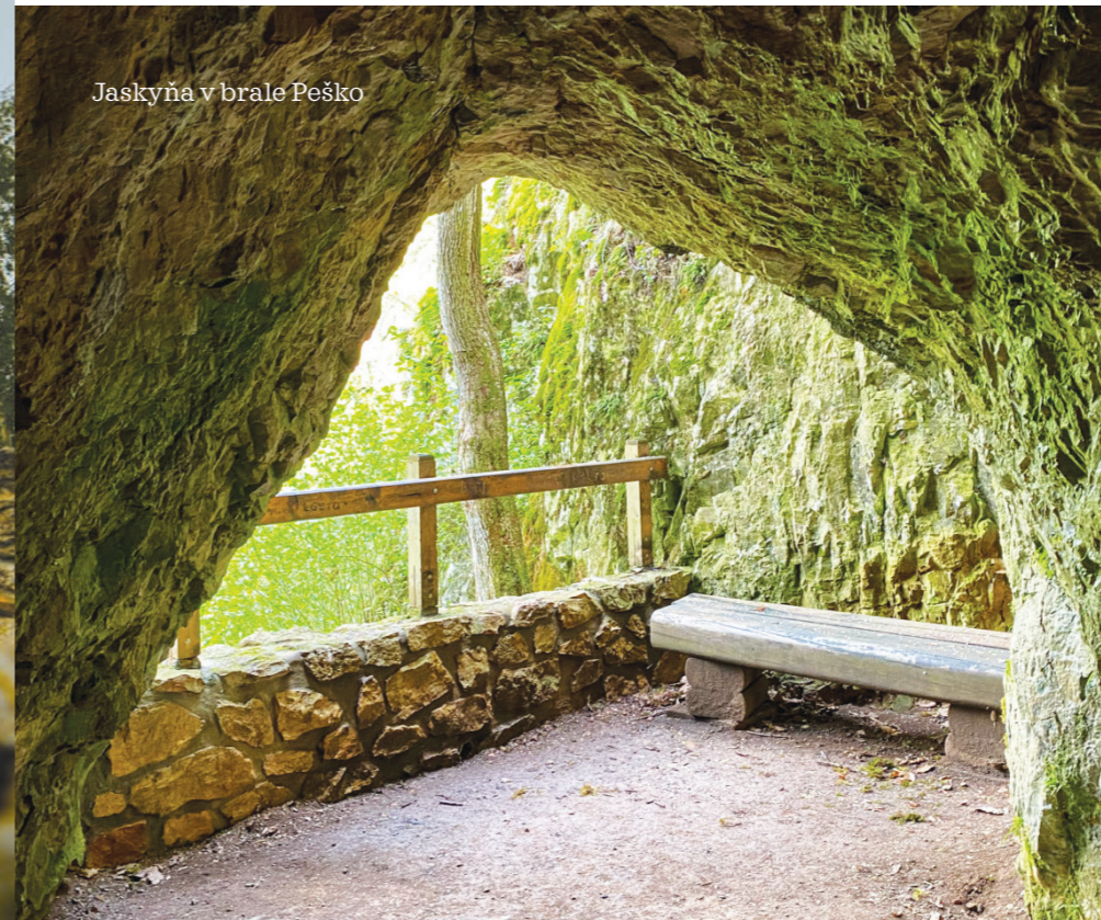
Jaskyňa v brale Peško

V útrobach chalúpok sa okrem iného darilo aj remeslu, konkrétne výrobe paličkovanej čipky. Rozvíjalo sa ako doplnkové zamestnanie, ktorým si privyrábali banícke ženy. V súčasnosti si návštevníci môžu pozrieť Múzeum tradičnej ľudovej kultúry, ktoré tu otvorili koncom leta 2012 počas 39. ročníka Gemerského folklórneho festivalu. Vznikla expozícia, ktorá dokumentuje život našich predkov. Nájdete tu tradičné vybavenie domu, náradie, kroje, bytový textil,