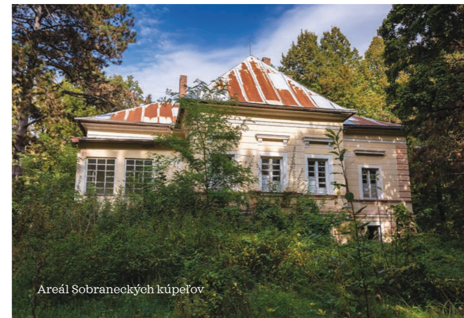
Areál Sobraneckých kúpeľov

Viac o Geoportáli Košického kraja na: www.geoportalsk.sk