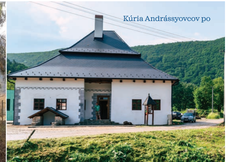
Kúria Andrassyovcov po