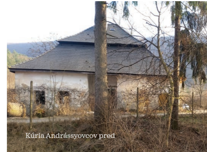
Kúria Andrassyovcov pred

níci sa tu na 10-tich zastávkach dozvedia zaujímavé informácie o histórii, kultúre, tradíciách a prírode, a to až v troch jazykoch. Neďaleko sa nachádza zrúcanina kláštora paulínov, Gombasecká jaskyňa či vyhladávková veža v podobe zvonice. Veríme, že turistická ponuka sa tu čoskoro rozšíri aj o veľký investičný projekt - zipline.