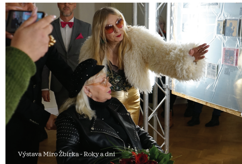
Výstava Miro Žbirka - Roky a dni