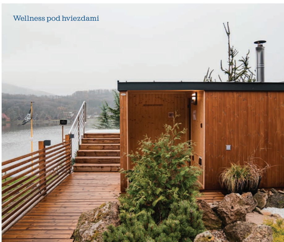
Wellness pod hviezdami

Počas jesene pribudol na východe skutočný unikát, aký nemá na Slovensku obdoby. Nová 35 metrová vyhliadková veža Green Point nad obcou Kluknava ponúka úžasný výhľad na scenériu Spiša. Vďaka podpore Košického samosprávneho kraja sa podarilo postaviť rozhľadňu, ktorá sa odlišuje nielen svojím unikátnym