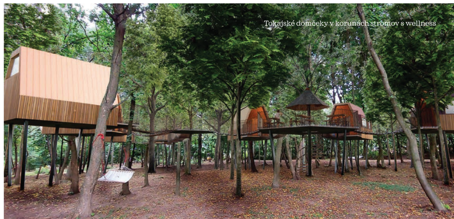
Tokajské domčeky v korunách stromov s wellness

dom. Lepšie podmienky pre cyklistov pribudnú i v okolí Ružínskej priehradu v smere do Hnileckej doliny obklopenej lesmi. Na Gemeri pribudne požičovňa bicyklov i solárna nabíjacia stanica a s osadením elektronábíjačky môžete rátať na Kojšovskej holi. Aj tieto projekty sú dôkazom toho, že okolitý prírodný potenciál sa snažíme využiť naplno.