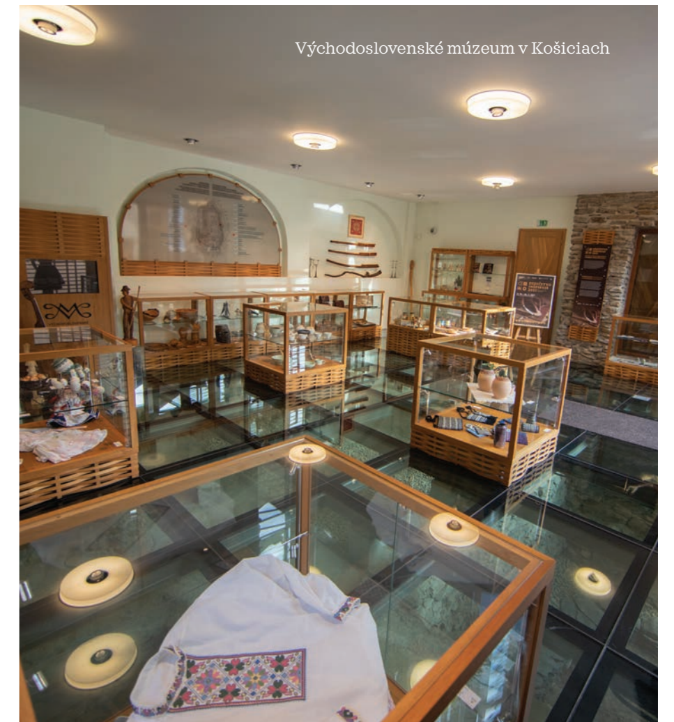
Východoslovenské múzeum v Košiciach

Druhé najstaršie múzeum na území Košického kraja oslavuje 120. narodeniny. Banické múzeum v Rožňave je rajom pre všetkých, ktorých zaujíma bohatstvo ukryté pod zemou. Už desaťročia ukazuje ťažkú prácu baníkov na Gemeri. Pri príležitosti jubilea už na jar sprístupní nový prehliadkový okruh Banská doprava, ktorého súčasťou bude aj nový nadrozmerový exponát - banský nakladač PN 1700.