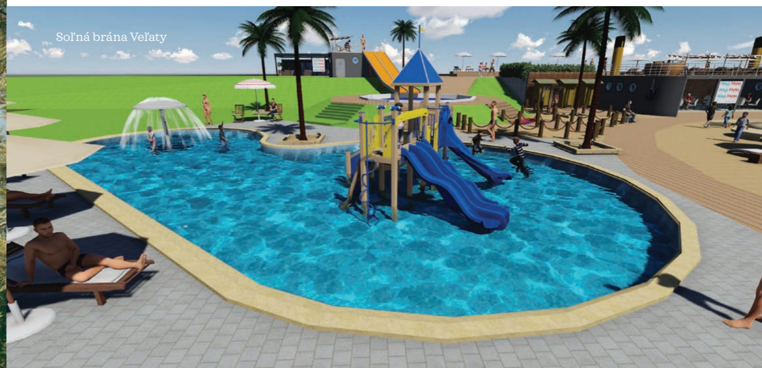
Soľná brána Veľaty

V tomto roku sa preto domáci aj návštevníci môžu tešiť na rozhábanie dokopy 25 projektov vo všetkých regiónoch. Napríklad, v obci Kluknava na Spiši vyrastie rozhľadňa, ktorá umožní sledovať krajinu, ale aj stáda lesnej zveri. O pár kilometrov ďalej si potom budete môcť vychutnať saunu v prírode, ktorú postavia v Harichovciach. Pre dobrodruhov chystá spoznávanie okolia Rejdová na Gemeri, a to v zákutiach Sterminy nad Hamriskami. Obec Vlachovo pripraví lahôdku pre fanúšikov hviezd v podobe astronomickej vyhliadky na Furmanci. Zemplínčanom pribudne splavovanie Bodrogu v okolí Ladmoviec