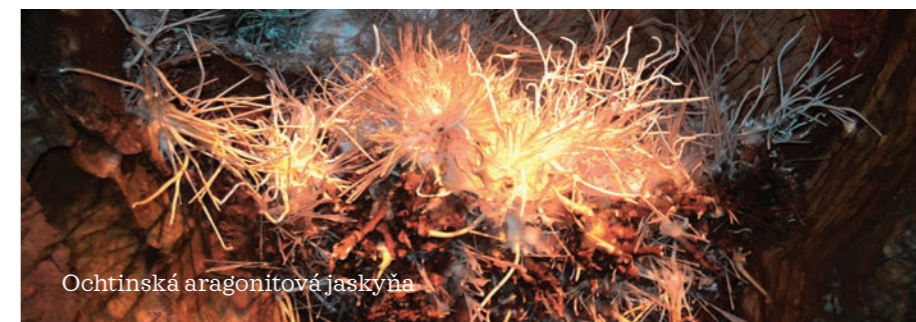
Ochtinská aragonitová jaskyňa

Jedna z málo prístupných jaskýň sveta svojho druhu. Vyniká jedinečnou aragonitovou výzdobou. Najvýznamnejším prvkom je takzvaný železný kvet, pripomínajúci svojim tvarom morský korál. Nemenej známa je sieň Mliečnej dráhy, kde nám aragonitová výzdoba pripomína pohľad na hviezdnu oblohu. Bežná jaskynná teplota neprevyšuje osem stupňov.