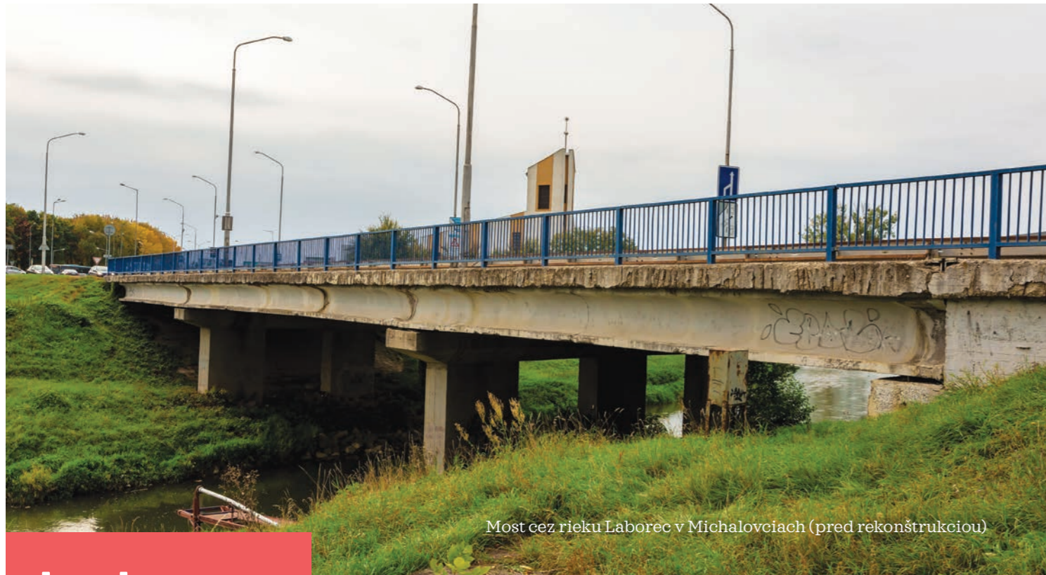
Most cez rieku Laborec v Michalovciach (pred rekonštrukciou)