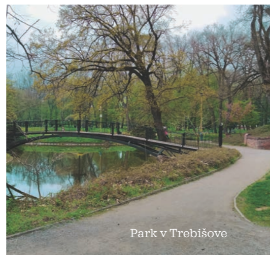
Park v Trebišove

Moderná interaktívna expozícia na ploche viac ako 1000 m 2 verne približuje Františka II. Rákocziho v čase, keď bol ešte len očakávaným dieťaťom. Prevedie vás životom sedmohradského veľmoža a vodcu protihabsburgského stavovského povstania až po smrť v tureckom Tekirdağ a prevoz telesných pozostatkov špeciálnym vlakom do Košíc.