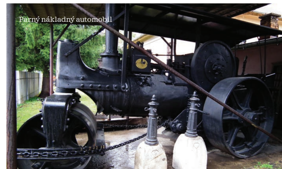
Parný nákladný automobil

Viac informácií spolu s možnosťou online zakúpenia lístkov nájdete na adrese: https://vylety.kosiceregion.com/vylety/