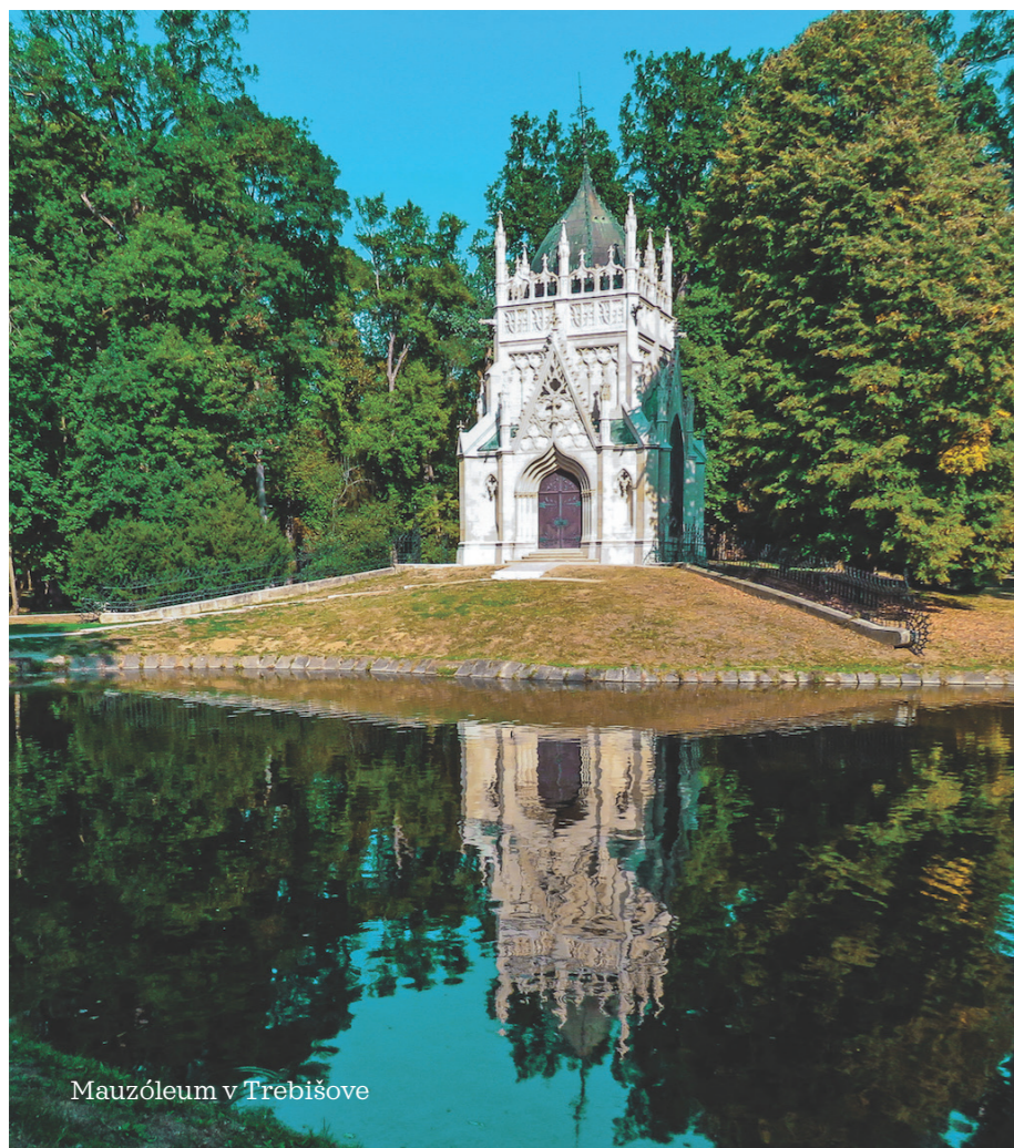
Mauzóleum v Trebišove