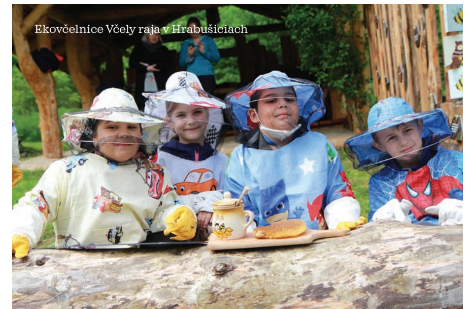
Ekovčelnice Včely raja v Hrabušiciach

Program Terra Incognita podporil aj nové zážitky k ubytovacím zaria-