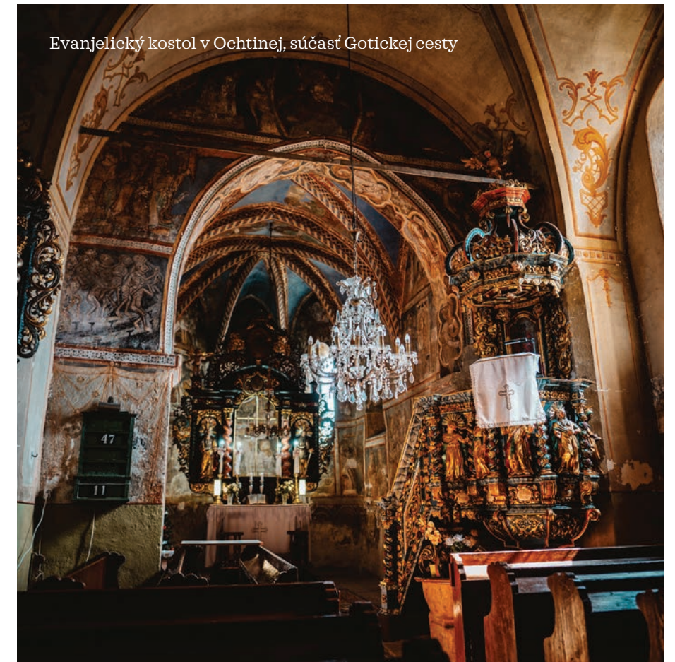
Evanjelický kostol v Ochtinej, súčasť Gotickej cesty

Vinianskeho jazera. Zatraktívni tak pobyt v regióne nielen počas hlavnej letnej turistickej sezóny, ale v prípade priaznivého počasia aj v jarných a jesenných mesiacoch. V roku 2024 sa máme naozaj na čo tešiť!