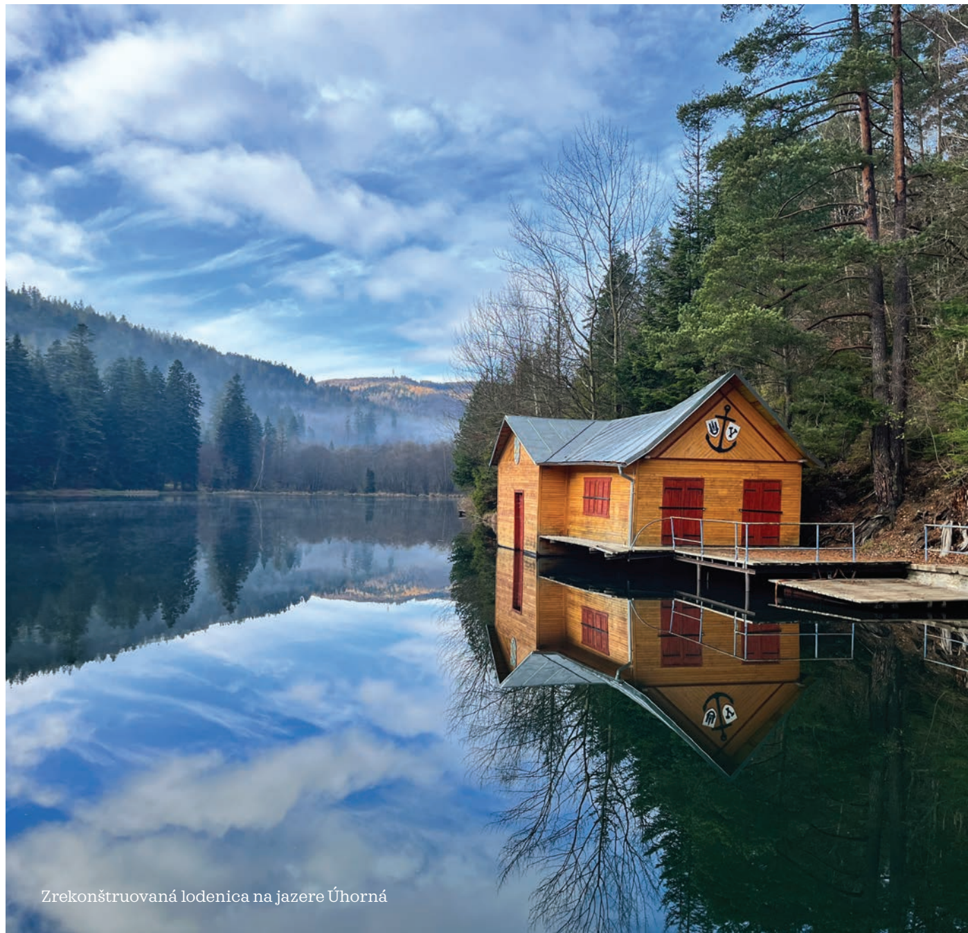
Zrekonštruovaná lodenica na jazere Úhorná

Z množstva skvelých nápadov vybrala odborná porota 22 jedinečných