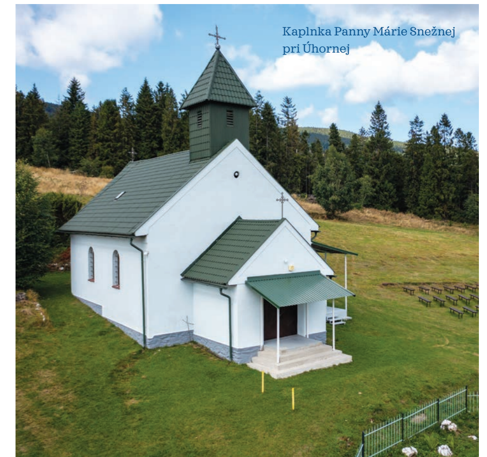
Kaplnka Panny Márie Snežnej pri Úhornej