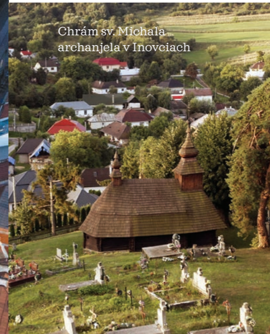
Chrám sv. Michala archanjela v Inovciach

sa udial eucharistický zázrak. Kňaz rozliat konsekrované víno na korporál, na ktorom sa vytvoril obraz Kristovej tváre. Korporál sa stal nositeľom relikvie Svätej krvi. Tieto relikvie boli umiestnené v Kaplnke svätého Michala, ktorú začali stavať okolo roku 1352 a krátko potom staviteľia rozbehli aj práce na Dóme sv. Alžbety. Jedno z minulosti najväčších pútnických centier východného Slovenska sa nachádza aj na neďalekej košickej Kalvárii. Jeho vznik iniciovali začiatkom 18. storočia košickí jezuiti. Dominantou je chrám dostavaný v roku 1758, ktorý je zasvätený Sedembolestnej Panne Márii. Cesta k nemu je lemovaná kaplnkami krížovej cesty v rokokovom štýle, ktoré sú zároveň pohrebnými kryptami košických rodín.