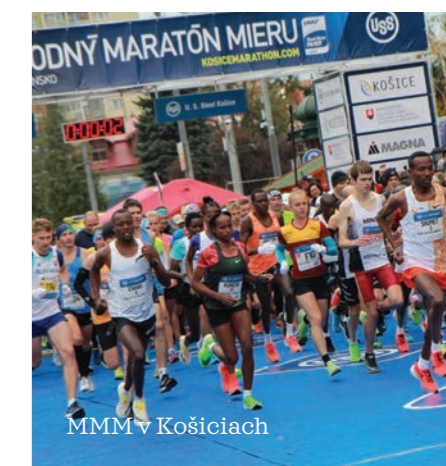
MMM v Košiciach