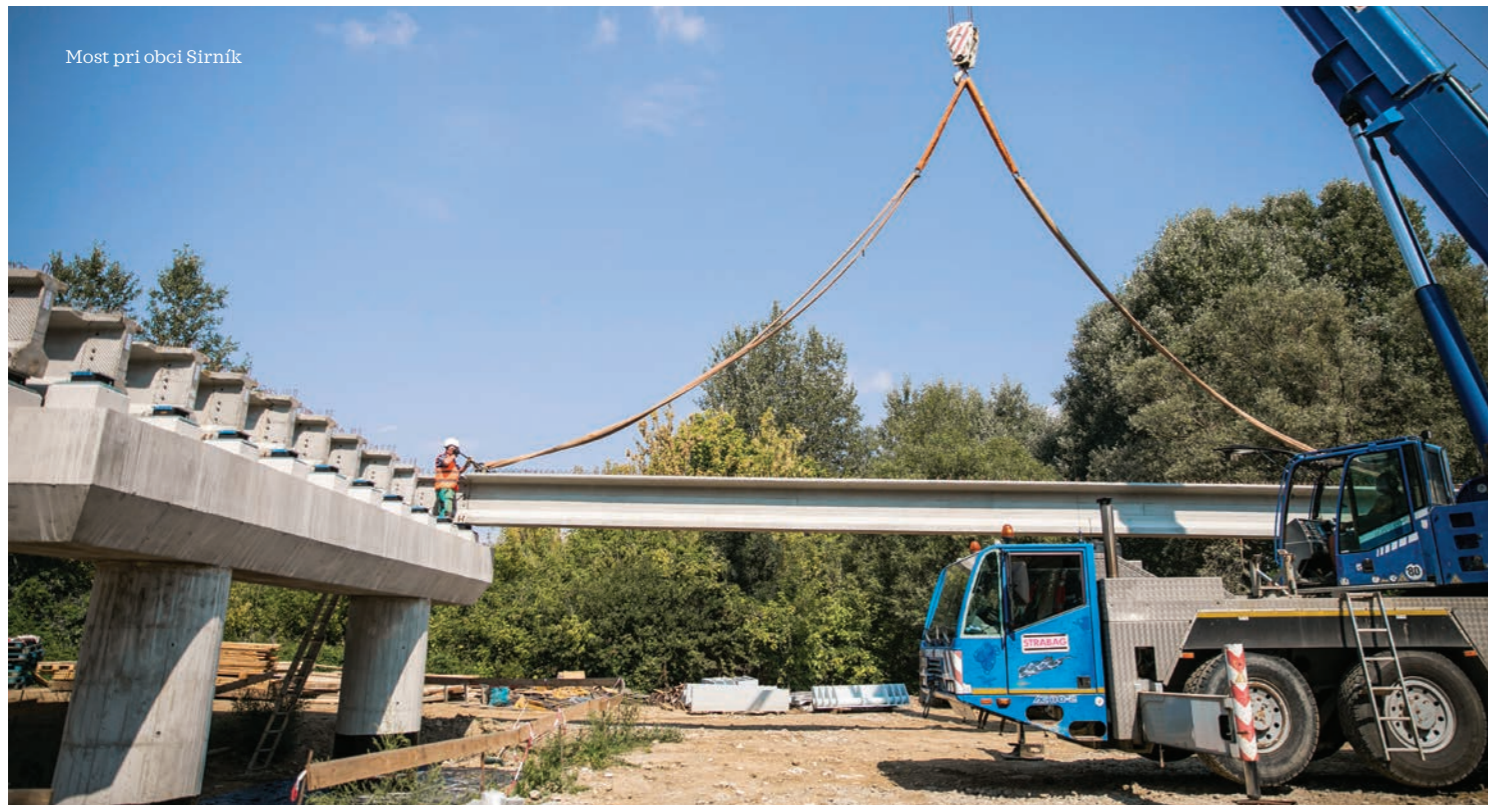
Most pri obci Sirník

Zatiaľčo most Sirník je v polovici svojej výstavby, pri Stretave opäť obnovili práce.