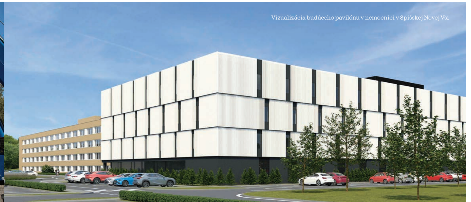
Vizualizácia budúceho pavilónu v nemocnici v Spišskej Novej Vsi

Rekonštrukciu ale aj prístavbu by mohli dostať nemocnice v Spišskej Novej Vsi a Michalovciach.