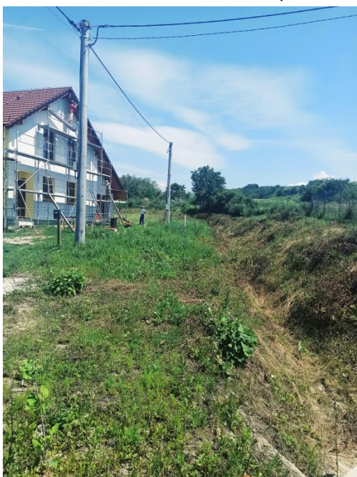
Obr.č.7: Riešenie odvodnenia na Poľnej ulici v Rozhanovciach. V lokalite sú novostavby a pred záplavami ich chráni hlboký jarok.