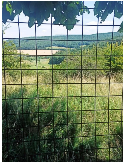
Obr.č.3, 4: Za plotom sa nachádza pozemok – zvernica vo vlastníctve Univerzity veterinárskeho lekárstva v Košiciach.