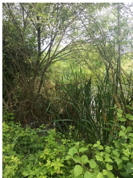
Obr. č. 9,10: Jazierko uprostred pasienkov a okolie jazierka, ktoré pán Zsóri upravuje a kosí.