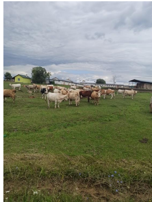
Obr. č.13,14: Stavebný odpad je, žiaľ, tiež súčasťou krajiny – neďaleko sa pasie dobytok farmy Agros. s.r.o. Gemerská Panica, v pozadí sú hospodárske budovy, sklad sena a stajne.