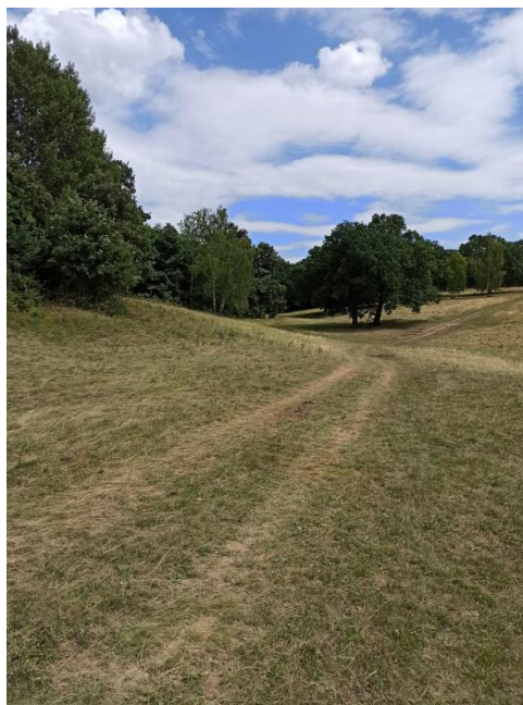
Obr.č.7,8: Typy pasienkov, ktoré Štefan Zsóri vytvoril mulčovaním a klčovaním zachovajúc a rešpektujúc charakter krajiny.