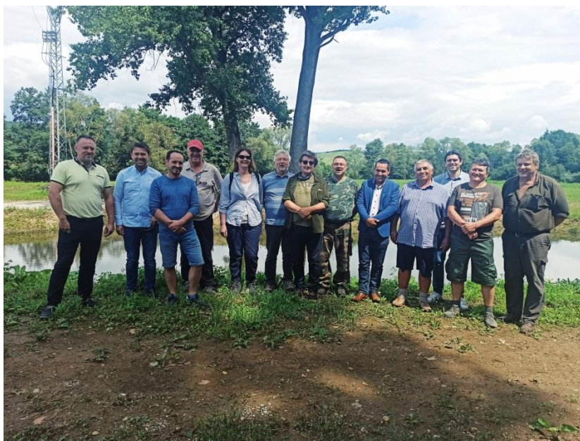
Obr. č. 1 Vodná rada okresu Rožňava pri jazierku v Čoltove, neďaleko malej vodnej elektrárne spoločnosti Kraft s.r.o. Plochu vlastní spomínaná firma a v okolí vytvorila voľnočasový priestor využívajúci prírodné danosti.