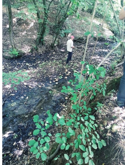
Obr. č. 11,12: Členovia vodnej rady pri vyschnutom koryte potoka v lesnom poraste popri pasienkoch, kde je potrebné prinavrátiť vodu.