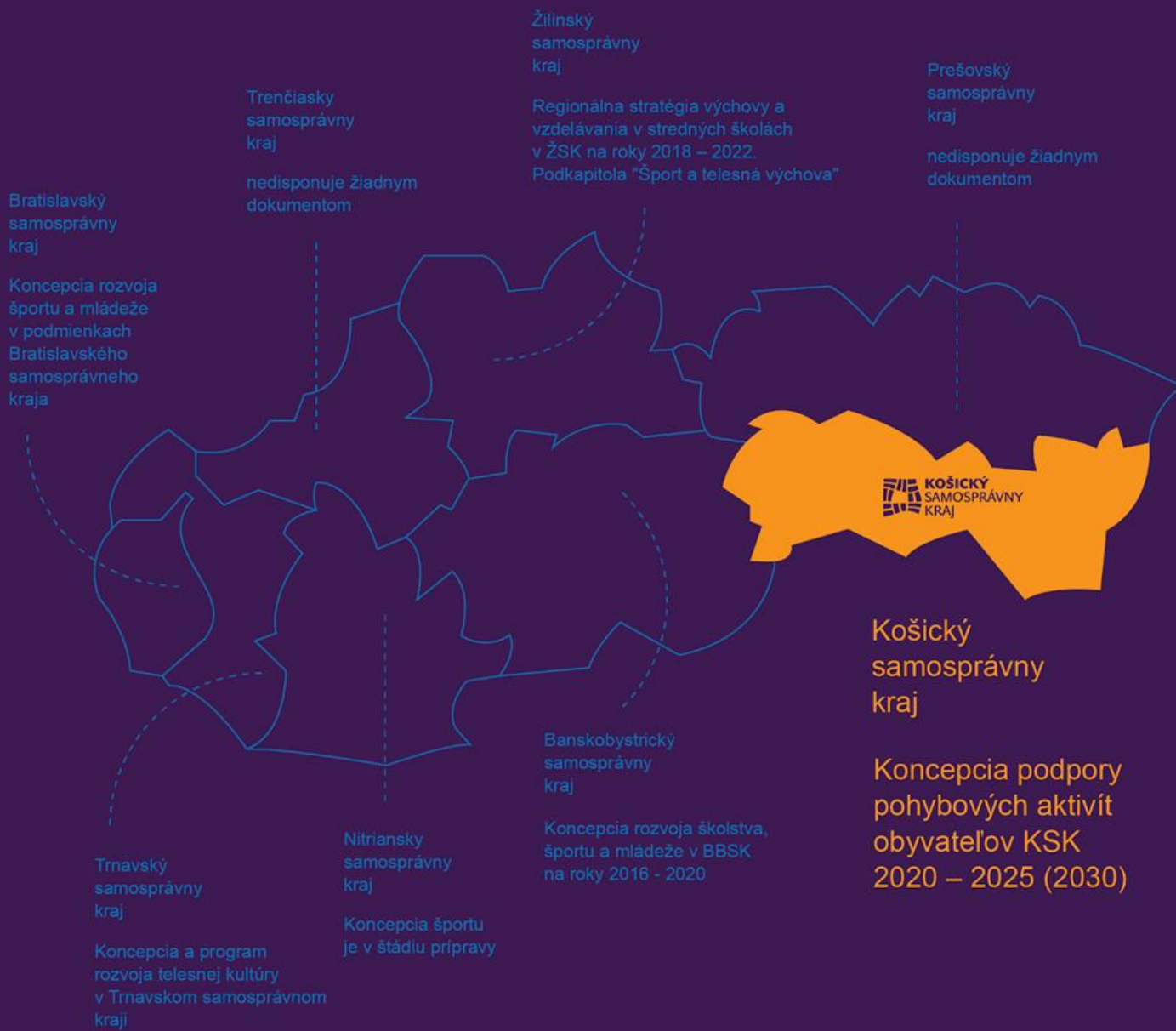
Obr. 1: Ilustrácia súčasného stavu Konceptíí športu v jednotlivých samosprávnych krajoch na Slovensku.