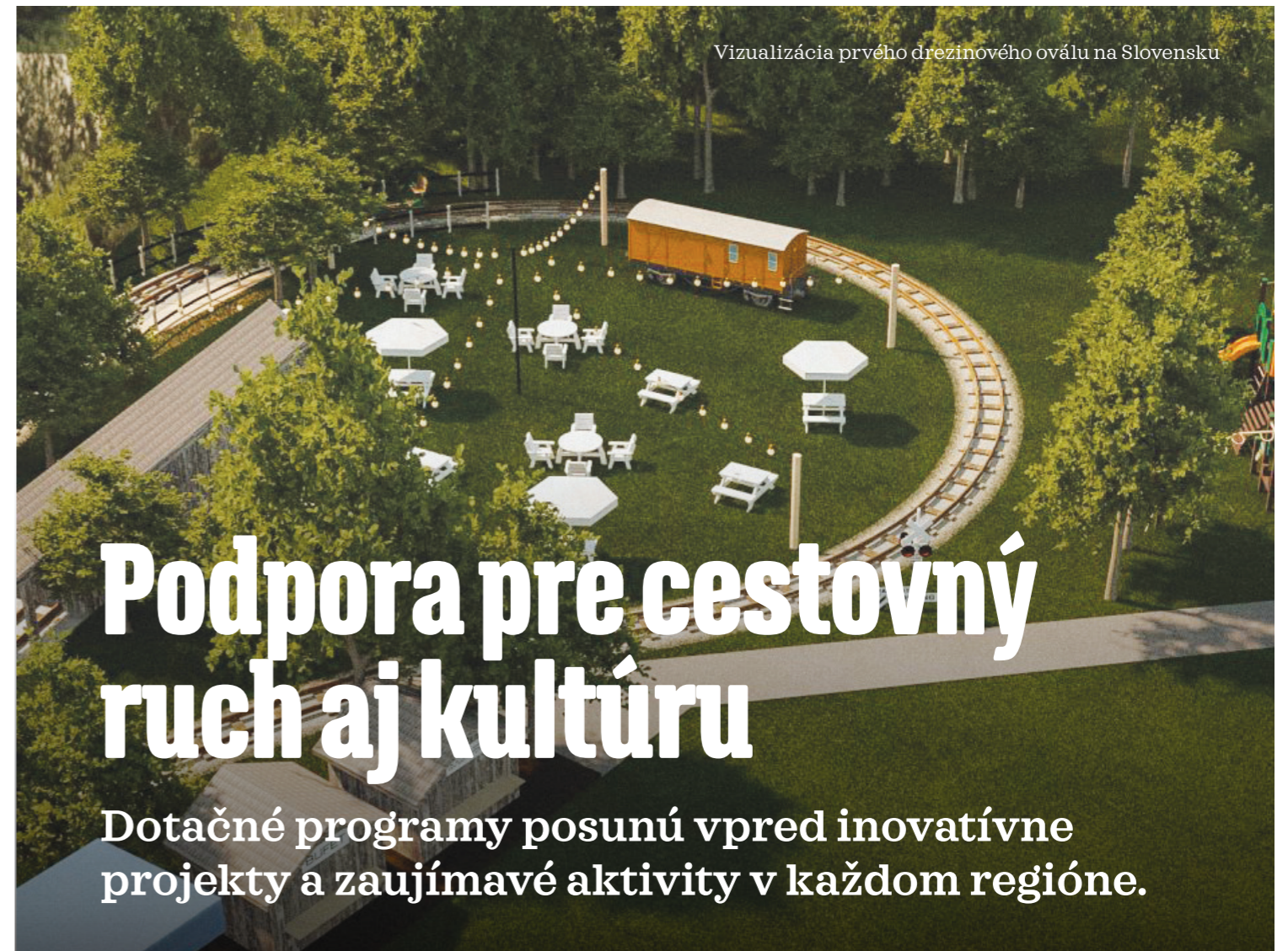
Vizualizácia prvého drezinového oválu na Slovensku