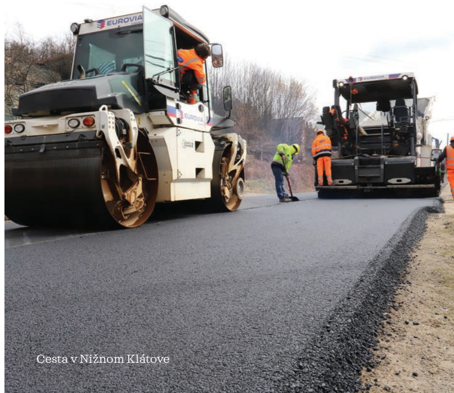
Cesta v Nižnom Klátove

V roku 2021 investujeme do cestnej infraštruktúry 40 000 000 eur.