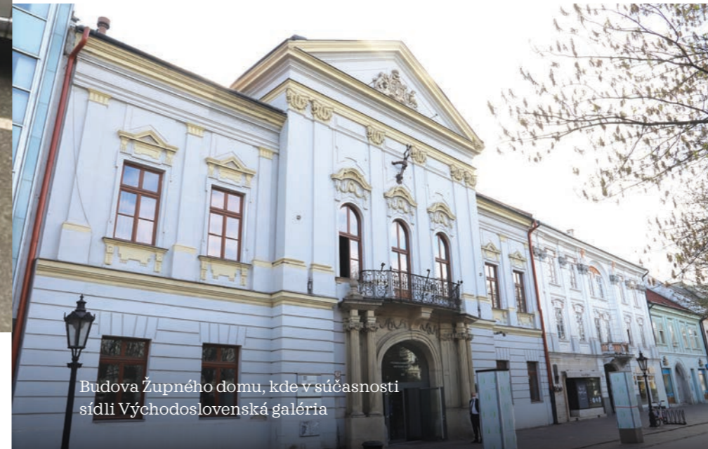
Budova Župného domu, kde v súčasnosti sídli Východoslovenská galéria

Ustanovenie významného dňa a župných dní má pripomínať hodnoty, ktoré nás posúvali ďalej a privádzali lepší život bližšie k domovom.