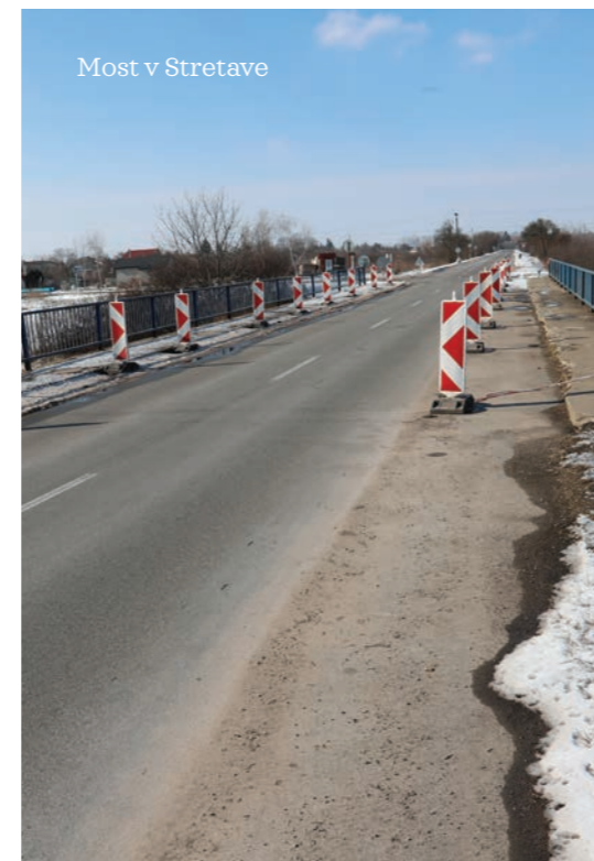
Most v Stretave

bude oprava cesty pri obci Úhorná cez Pačanský kopec, ktorý je roky v zlom stave. Pri opravách ciest kraj okrem výmeny asfaltu opravuje aj podložie, spevňuje krajnice, čistí priekopy alebo buduje nové priepusty a oporné múry. Kým pri bežnej úprave asfaltu a novom nátere sa trhliny objavia už do piatich rokov, pri oprave cesty s úpravou podložja je jej životnosť približne 20 rokov. „ Tieto rekonštrukcie sú síce niekoľkonásobne drahšie, no výtlky sa neobjavia hneď po „prvej zime“. Pri opravách ciest sa snažíme riadiť pravidlom, že do kvality sa oplatí investovať, “ dodal Trišč. Kraj ráta v tomto roku s opravou piatich mostov typu Vloššák, kde už niekoľko mesiacov platia dočasné dopravné obmedzenia, a to most cez nápuštný kanál do Zemplínskej šíravy, most cez poľný kanál pred obcou Topoľany, most cez potok v Sečovciach, most cez potok Čechanka za Mokrancami a most cez záchytný kanál pred obcou Záhor. Opravy sa dočká aj most v Stretave, ktorý je na pokraji životnosti.